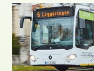
Stadtwerke Radolfzell GmbH