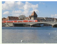
DB Regio AG