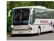
Firma Schmidbauer e.K.