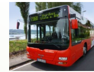
SBG SüdbadenBus GmbH