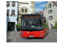
DB ZugBus RAB