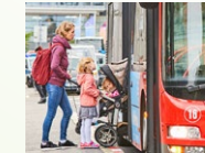
Stadtwerke Konstanz GmbH